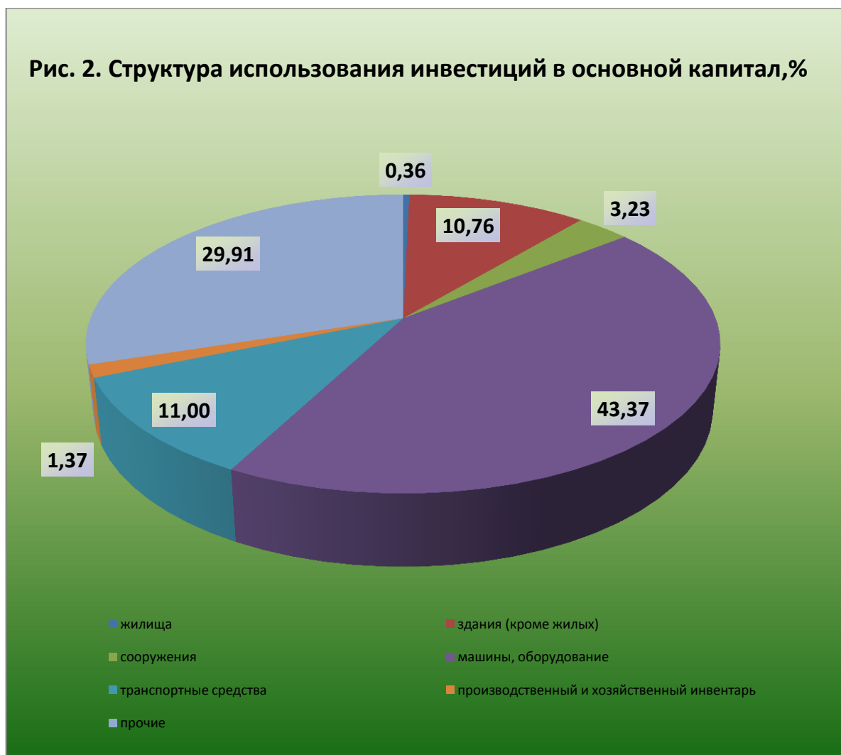
Рис. 2. Структура использования инвестиций в основной капитал, %