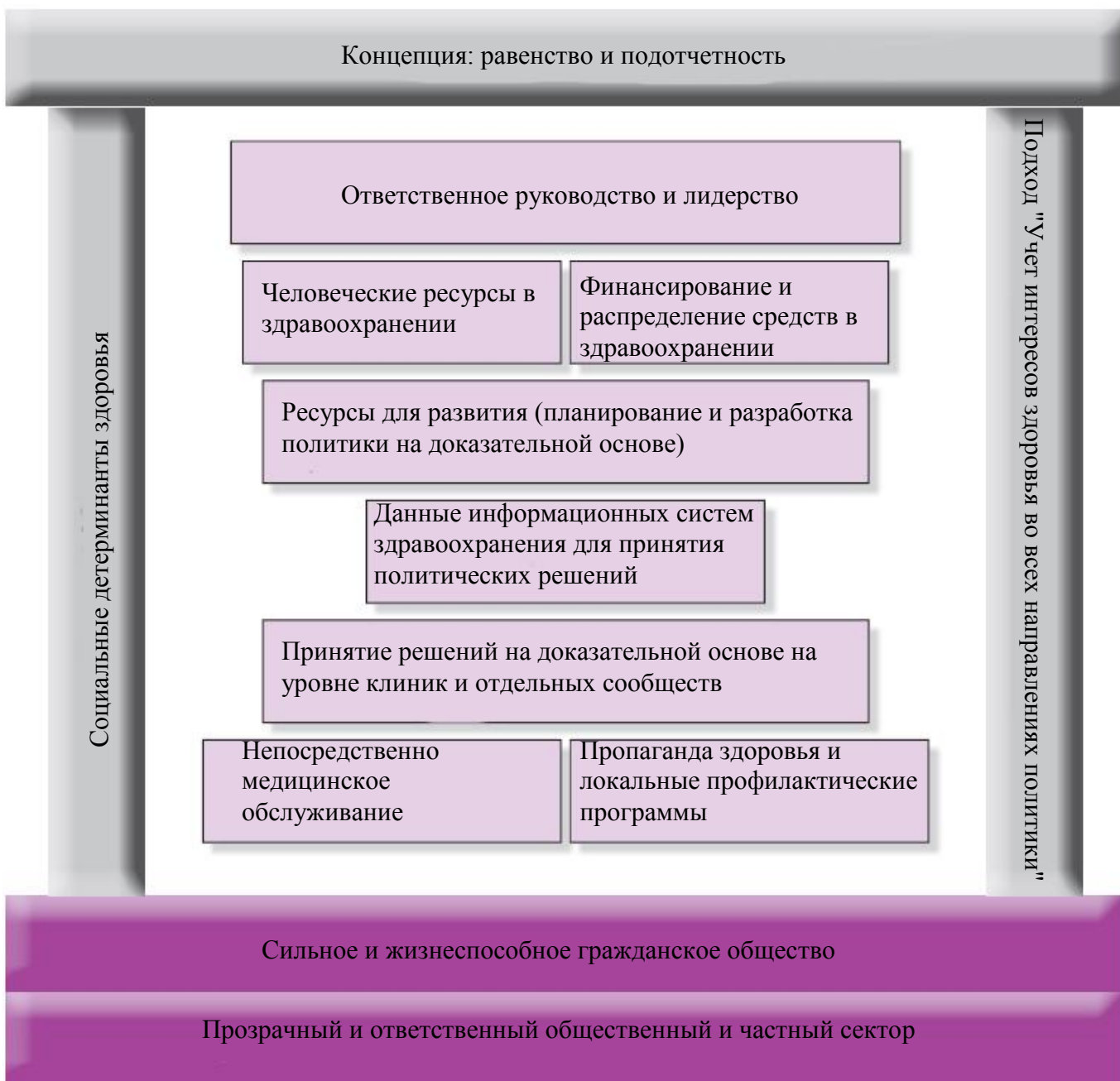
Рисунок 1. Модель укрепления систем здравоохранения CSIH