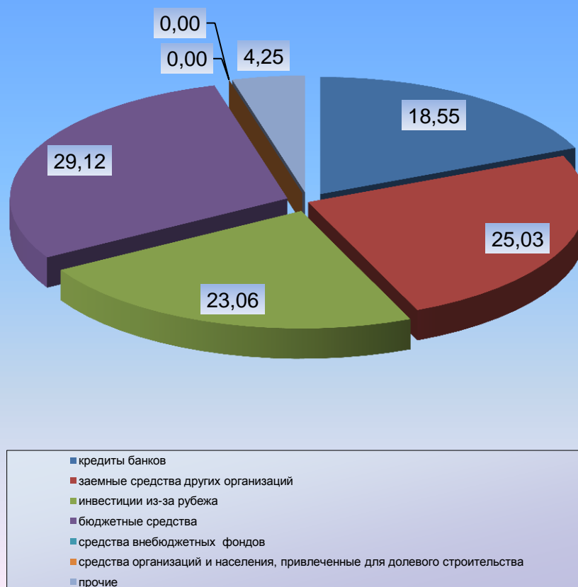
Рис. 1. Структура привлеченных средств инвестиций в основной капитал, %