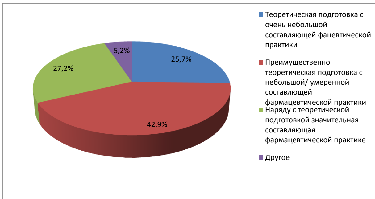
Рисунок 1. Характеристика основных образовательных программ с точки зрения их ориентации на фармацевтическую практику