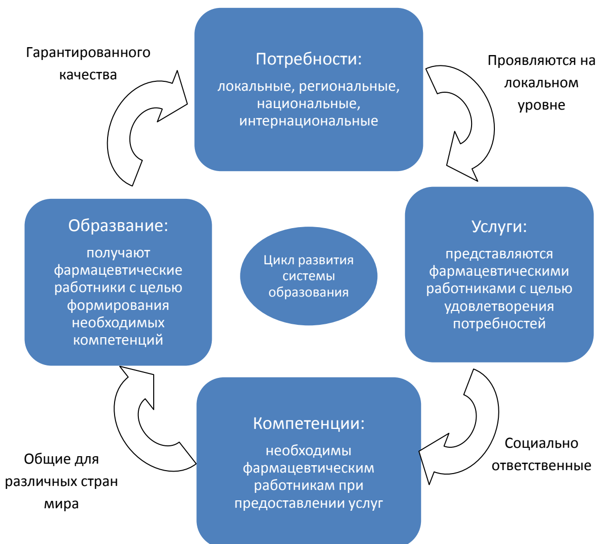
Рисунок 2. Детерминированная потребностями модель профессионального фармацевтического образования (цикл развития системы образования, обусловленный потребностями (FIP-WHO-UNESCO Pharmacy Education Taskforce))

Потребности локальные, региональные, национальные, интернациональные