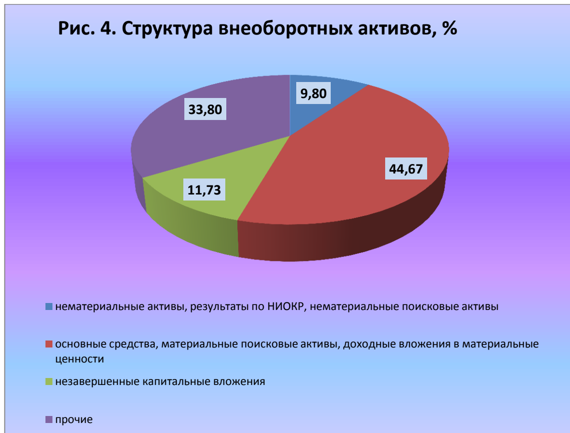
Рис. 4. Структура внеоборотных активов, %